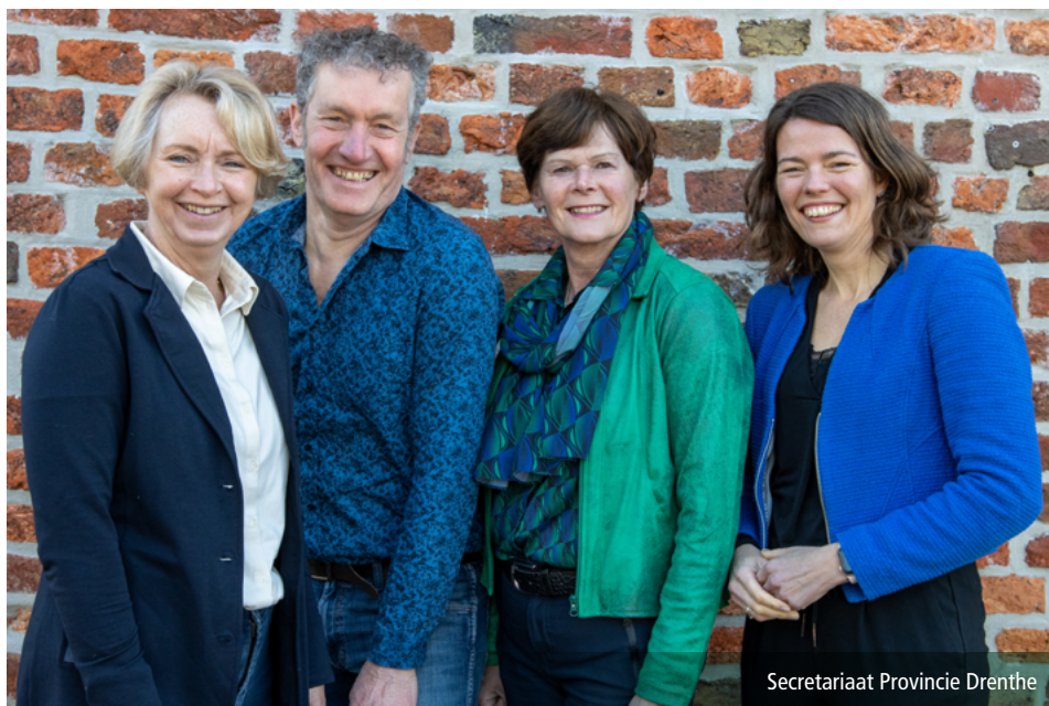
Secretariaat Provincie Drenthe